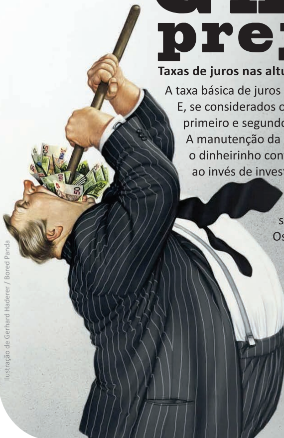
Ilustração de Gerhard Haderer / Boreci Panda

Esta ganância prejudica o Brasil e o povo brasileiro.